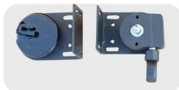
Posición original, Fijación a pared, enrollado a la derecha.