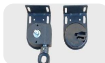
Fijación a techo enrollado izquierdo.