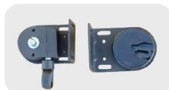
Fijación a pared enrollado izquierdo.