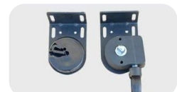
Fijación a techo enrollado derecho